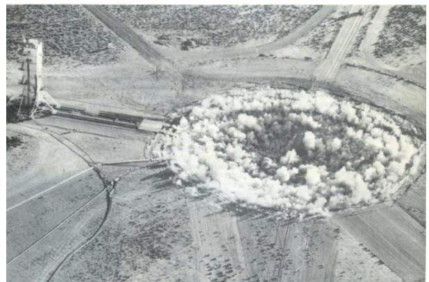
Een minuut na een ondergrondse kernproefexplosie in de Nevadawoestijn

Door zijn aanwezigheid ziet Dirk Jan ook een mogelijkheid om al die vele al dan niet christelijke basisbewegingen van Noord-, Midden- en Zuid-Amerika te ondersteunen en samen met hen het Noord-Zuidvraagstuk aan de orde te stellen. Bij dat Noorden denkt hij niet alleen aan het kapitaal en het bedrijfsleven van de VS, maar evengoed aan die van Europa, die zich op een koloniale manier blijven gedragen. 'Als door onze onderneming naast mijzelf ook een aantal mensen in het Noorden over hun houding ten aanzien van het Zuiden gaat nadenken, dan is voor mij de EPP '92 geslaagd.'