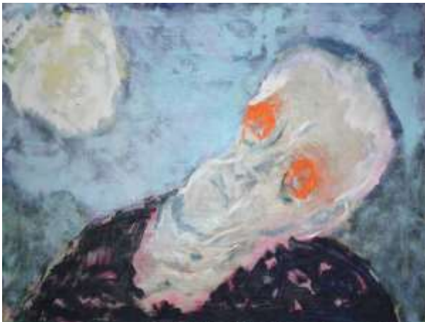
Cecile Reijnders Oude dame in de zon (1994) olieverf op linnen 60/80 cm

In dat interview maakt hij zich zorgen over de participatie van ouderen in de samenleving. Dat valt te prijzen. Maar daarmee diskwalificeert hij zoveel andere ouderen die volop bezig zijn. Vaak tot op zeer hoge leeftijd.